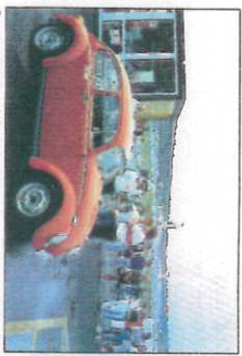
September '89 in Hockenheim: